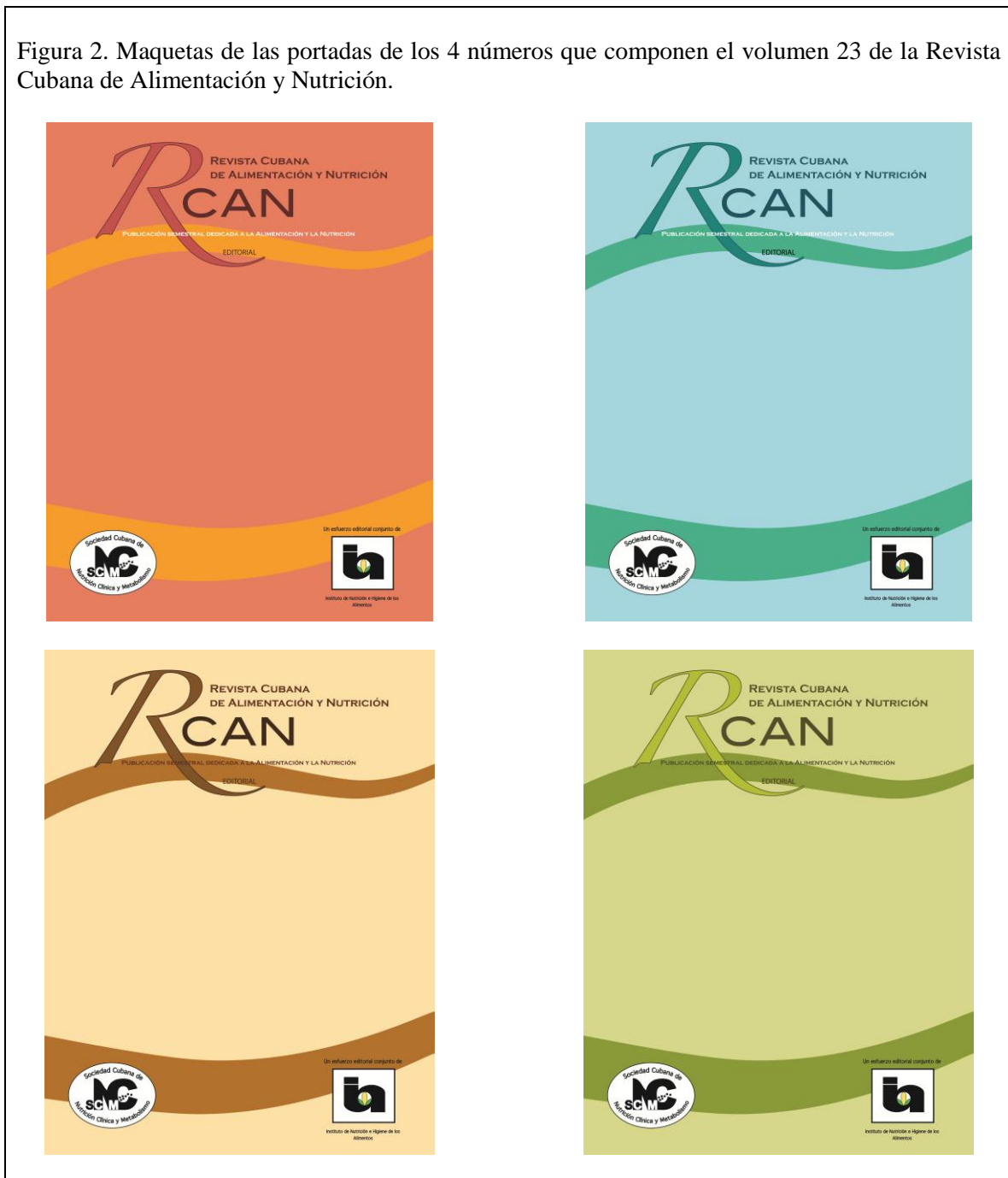
Figura 2. Maquetas de las portadas de los 4 números que componen el volumen 23 de la Revista Cubana de Alimentación y Nutrición.

Pero percibo que el momento ha llegado para hacer algunos cambios en el diseño de la portada de la Revista, aunque sea en los números que compondrán el volumen 23 de la misma. Cuatro diseños diferentes se han propuesto para otros tantos números que verán la luz en este año 2013. La portada de cada una de los números de este vigésimo tercer volumen de la Revista tendrá el mismo diseño, pero será el color quien los identifique: salmón, acqua , ocre, o verde.