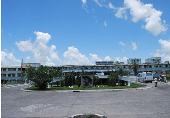
Figura 1. Hospital General Provincial “Camilo Cienfuegos”. Portada principal.

Fueron encuestados los pacientes ingresados en la institución durante Julio del 2012 y Noviembre del 2012 (ambos inclusive). El estado nutricional del enfermo fue establecido mediante la Encuesta Subjetiva Global (ESG) propuesta por Detsky et al. 8 La ESG asigna uno de 3 puntajes posibles en base a los cambios recientes ocurridos en el peso, los ingresos dietéticos, y la autonomía y validismo del enfermo, la sintomatología gastrointestinal, la afectación de la masa muscular esquelética y el tejido adiposo, y la presencia de edemas en miembros inferiores y ascitis.