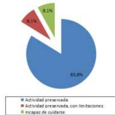
Figura 2. Estado de la capacidad funcional del nefrótico sujeto a diálisis peritoneal, medida según el índice de Karnofsky.

La Tabla 4 muestra la frecuencia de los trastornos nutricionales observados en la presente serie de estudio y las variables bioquímicas determinadas. Tampoco se pudo demostrar una asociación clara entre el estado nutricional y el valor corriente de la variable bioquímica.